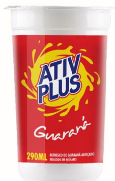
ATIV PLUS GUARANA 290ML 4842