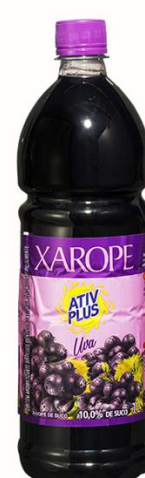
ATIV PLUS XAROPE DE UVA 1LT 2263