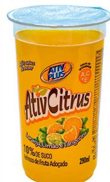
ATIV PLUS CITRUS 290ML 4846