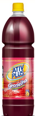
ATIV PLUS XAROPE DE GROSSELHA 1LT 4864