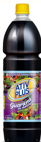
ATIV PLUS XAROPE DE GUARANA C/ACAI 1LT 4890