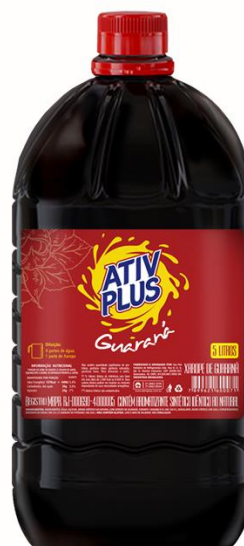
ATIV PLUS XAROPE DE GUARANA 5LTS 4865