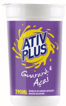
ATIV PLUS GUARANA COM ACAI 290ML 4844