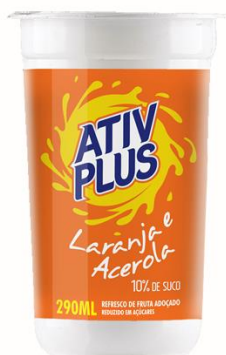
ATIV PLUS LARANJA/ACEROLA 290ML 4843