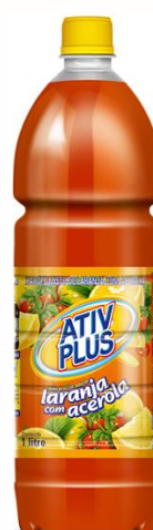
ATIV PLUS XAROPE DE LAR. C/ACEROLA 1LT 4891